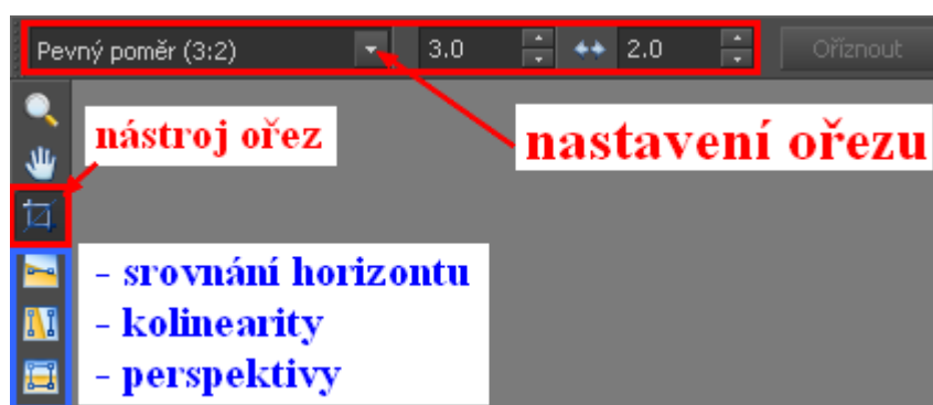
Zobrazení na třetiny