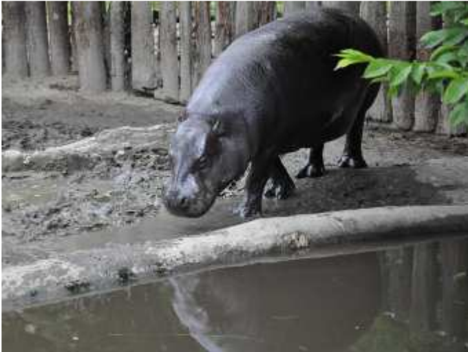
původní obrázek (poměr 4:3)