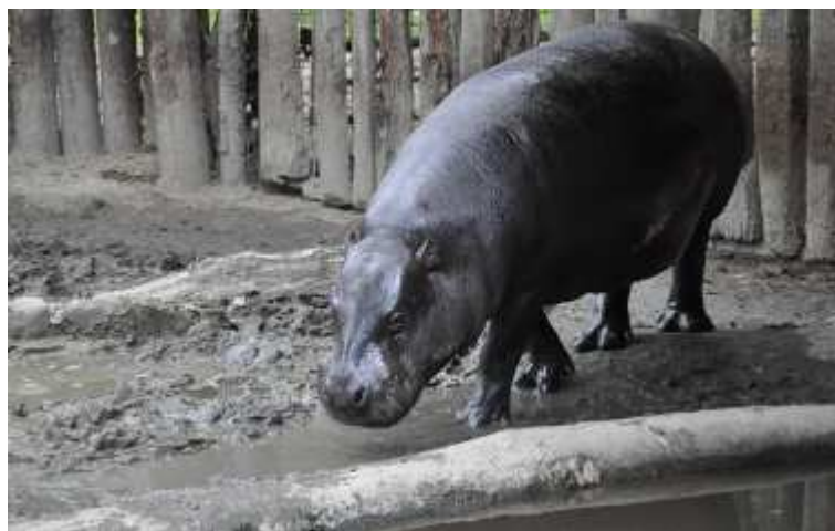
Hotovo (ořez do poměru v našem případě 3:2)