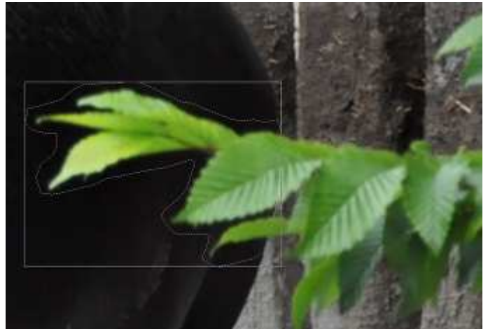
přiblížení a výběr oblasti