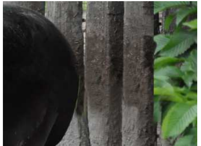
retušování listů na plotu + rozmazání přechodů mezi výběry